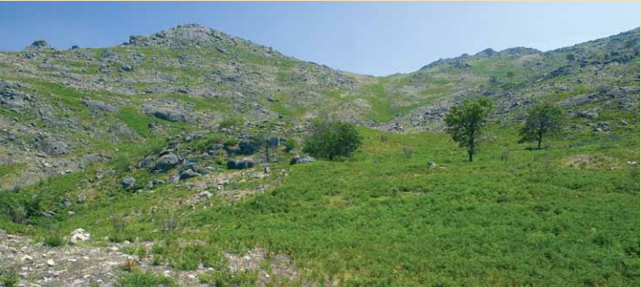
Chã da Escusalha e Tombaril

Percurso pedestre de pequena rota (PR), desenvolve-se na Serra Amarela, cujo ponto mais alto é o Coto do Muro a 1361 m de altitude.Tem por tema o Megalitismo (expressão utilizado para designar construções pré-históricas, de grandes dimensões, com função religiosa e simbólica) e a arte rupestre (pinturas ou gravuras feitas nas pedras ou em grutas pelos homens da pré-história) na freguesia de Britelo.