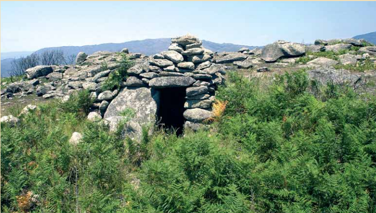
Anta na Chã da Escusalha

Retome o percurso até à Chã da Escusalha. Aqui encontrará um primeiro grupo de monumentos da Necrópole Megalítica de Britelo onde poderá observar quatro antas,uma das quais foi reaproveitada como abrigo de pastores.