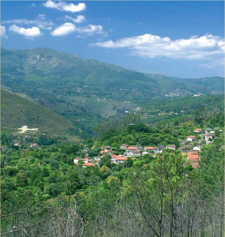
Vista geral da aldeia de Britelo

Continue o percurso até ao estradão florestal, vire à direita e desça calmamente, apreciando agora a panorâmica sobre o vale do Rio Lima. O percurso termina novamente na povoação de Britelo,típico povoado de vale. Poderá ainda visitar os outros lugares desta freguesia: Paradamonte e Mosteirô.