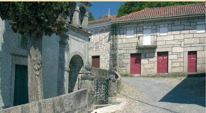
Pormenor da aldeia de Britelo

O percurso tem início na povoação de Britelo, num pequeno largo, junto de um fontanário. Atravesse a aldeia seguindo a sinalética, contorne a igreja e suba a calçada por entre as casas e os campos.Percorridos cerca de 700 m vire à esquerda e entre num caminho carreteiro em terra batida. Suba sempre pelo caminho que gradualmente se transforma num estradão florestal que passa, um pouco mais à frente,junto à Chã da Rapada.