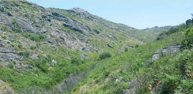
Vale da Ribeira da Abelheira

No extremo oposto da chã, tome um caminho de pé posto até à Ribeira da Abelheira. Continue, agora pela margem direita da ribeira, seguindo o trilho de pé posto por cerca de 500 m.Passe para a margem esquerda e continue pelo caminho de pé posto. Junto da ribeira verá, na outra margem, exemplares de património da Idade Moderna:as ruínas de dois moinhos, uma silha (construção circular em pedra para protecção das colmeias), e os primeiros muros e tanques de água dos campos de cultivo.