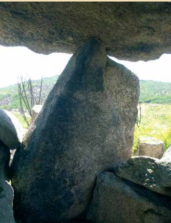
Interior da Lapa da Moura

Atravesse o Vale da Coelheira e siga o caminho carreteiro até à linha de água. Passe a linha de água e suba até à portela em frente, flanqueada por quatro pinheiros. Passado estes, estaremos na Chã de Cabanos, um outro núcleo megalítico da Necrópole de Britelo. Deste conjunto de monumentos destaca-se a Lapa da Moura , possivelmente o maior monumento funerário megalítico da Serra Amarela. No interior desta anta, que mantém ainda a sua câmara funerária, encontram-se nos esteios, vestígios da arte dos construtores de megálitos sob a forma de gravuras e pinturas.